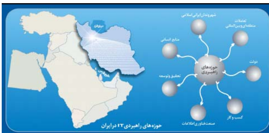
شکل ۲ - حوزه‌های هفتگانه راهبردی فناوری اطلاعات کشور

"جامعه و شهروندان"، "توسعه منابع انسانی باکیفیت"، "دولت و شیوه مدیریت عمومی و ارائه خدمات و سرویس‌های مورد نیاز و به‌روز در جامعه"، "تحقیق و پژوهش و نوآوری فناوری"، "توسعه صنعت فناوری اطلاعات" و "کسب‌وکارهای مبتنی بر فناوری اطلاعات" و "چگونگی تعامل محیط ملی و فراملی با شبکه‌های جهانی اینترنت، کشورها، بنگاه‌ها و بازارها".